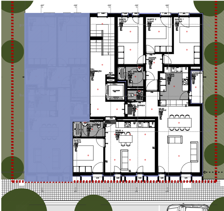
PLANTA PISO 3 - PROPOSTA